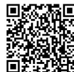
オミクロン株に対する追加接種後の発症予防効果